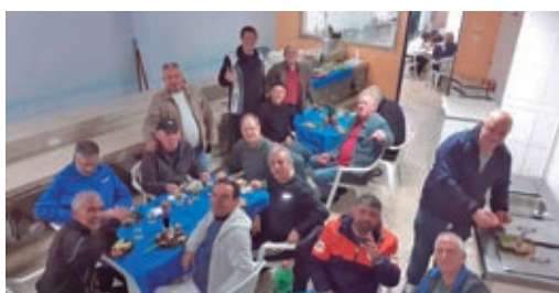
Confraria da Quarta