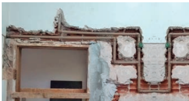
Reestruturação dos Banheiros - Aumento do vão das portas

Aprovamos o projeto que trata do PSCIP (Plano de Segurança Contra Incêndio e Pânico), que está sendo implantado com a realização das obras pertinentes para obtenção do Alvará de funcionamento. As obras na subsede em Maringá trarão maior segurança aos nossos usuários e para a locação do espaço para terceiros na realização de eventos através da empresa Espaço AB.