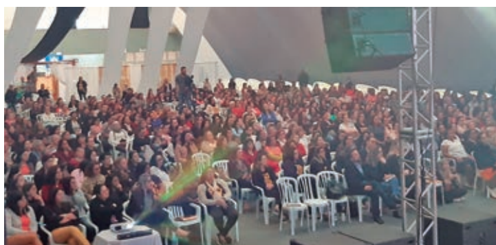
Encontro de Pastorais da igreja "Ó Brasil para Cristo"