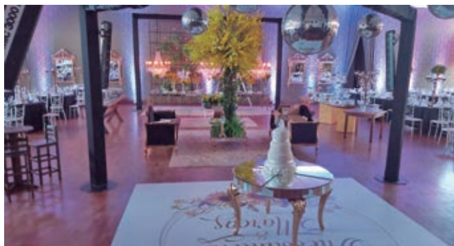
Salão de Festas - Recepção de casamento