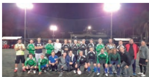
Turma da Segunda

São grupos de associados que se reúnem há muitos anos, mantendo a tradição das atividades esportivas da AB. Agora também foi criado o grupo de condicionamento físico com mais de 40 associados que se reúne às 18:00 h nas segundas, quartas e sextas-feiras.