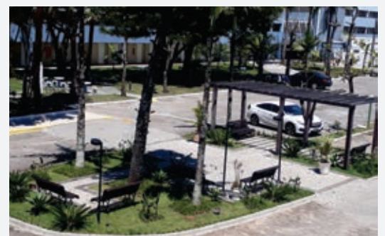
Praça em frente a recepção