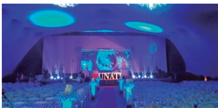
Formatura UNATI - Universidade Aberta da Terceira Idade