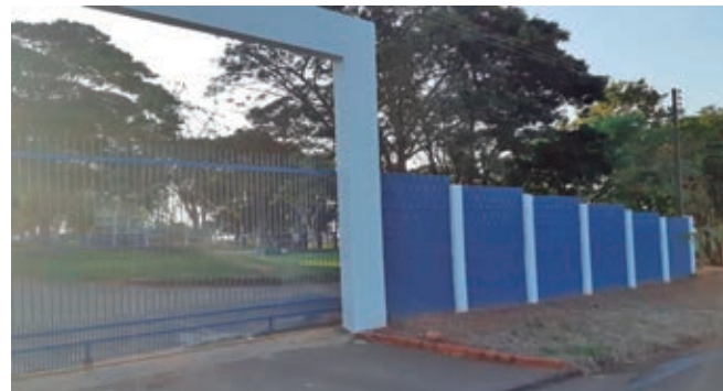
Pórtico de Entrada